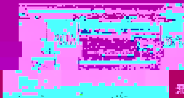
教育技术部汇报工作

会议期间，各系部主任汇报工作，汇报内容涉及本科、硕士、博士、专业学位、教育技术、教育管理等各个方面。会议期间，与会领导对汇报内容给予了肯定，并就汇报内容提出了宝贵意见和建议。